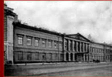
Коллегия иностранных дел. Английская набережная, 32.

• 7. По окончании Лицея Пушкин был зачислен в Коллегию иностранных дел.