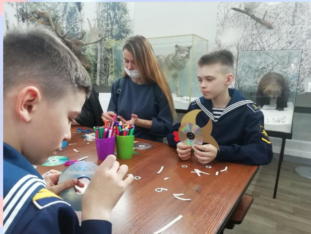
Сотрудничество с Краеведческим музеем