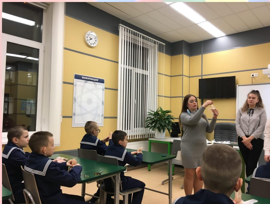
Сотрудничество с творческим коллективом Мурманского педагогического колледжа