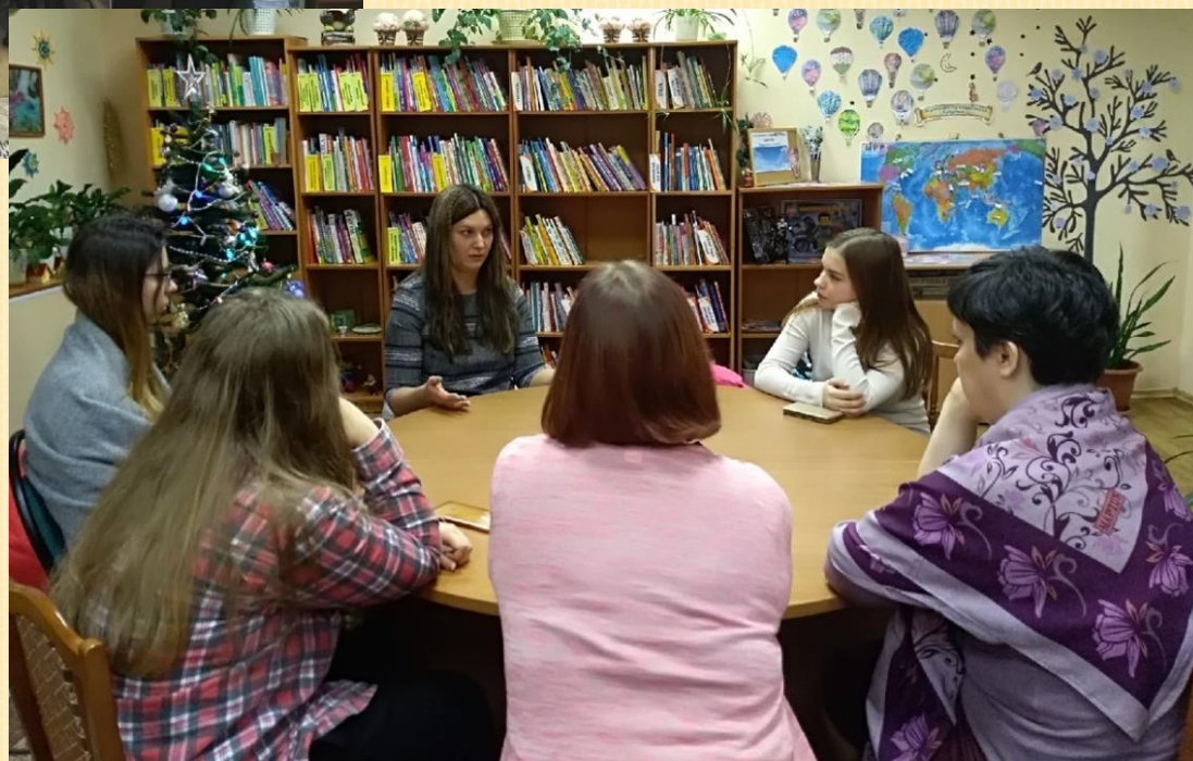
Мурманский арктический государственный университет