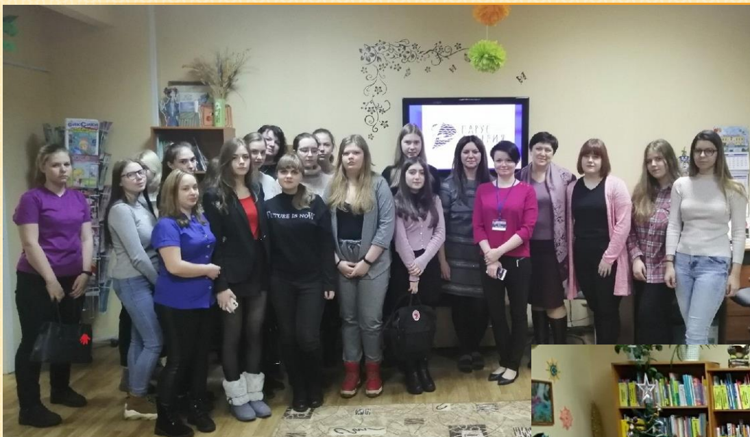
Мурманский педагогический колледж