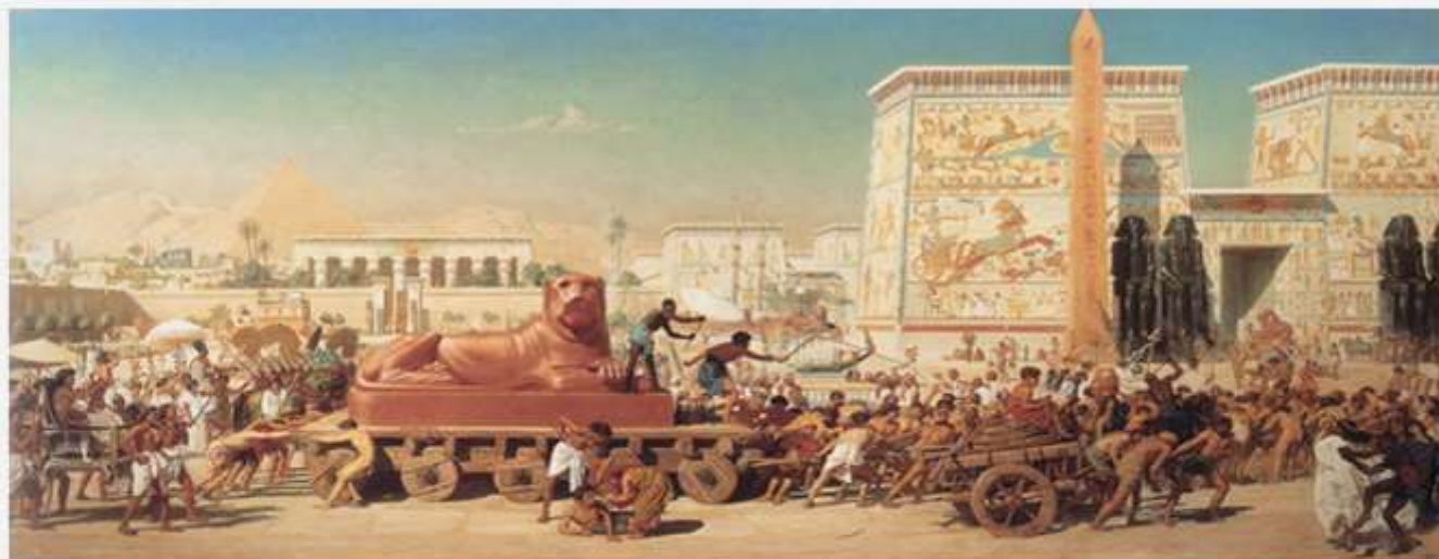
Израиль в Египте. Художник Э. Пойнтер. XIX (19) в.