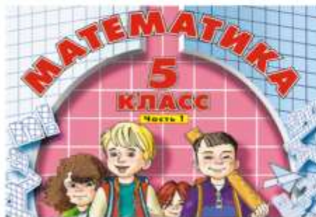
Математика, 5 класс, Часть 1