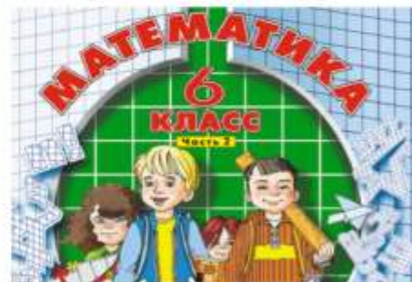
Математика, 6 класс, Часть 2