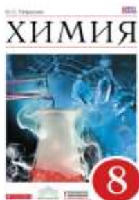
Дрофа. Химия. Тест 8