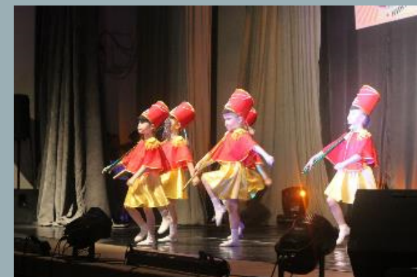
Воспитанники «МБДОУ № 1» выступают на сцене ДК «Восход»