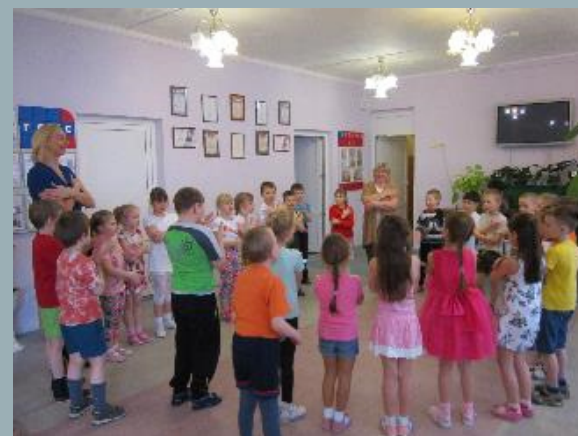
Дети детсада с концертом в ГОАУСОН «Печенгский КЦСОН»